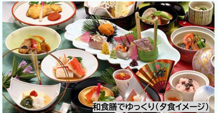
和食膳でゆっくり(夕食イメージ)