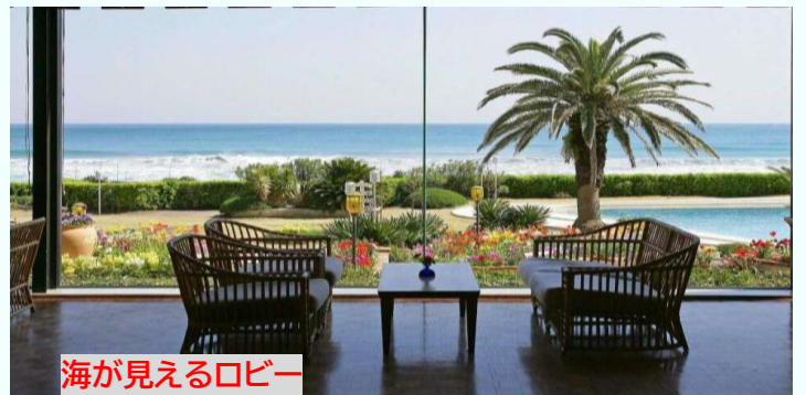
海が見えるロビー