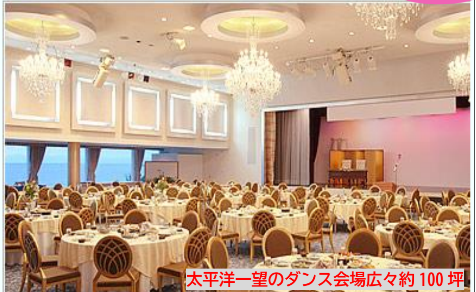
太平洋一望のダンス会場広々約100坪